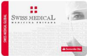
Cred. SMG Global Santander